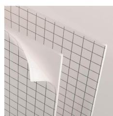
Pannelli - Due lati adesivi ( 5 e 10mm )