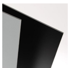
Pannelli Domino ( 5mm )