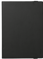
PRODUCT FRONT 1