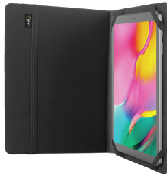
PRODUCT VISUAL 3