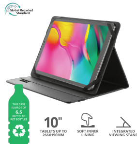
PRODUCT ESHOT 1