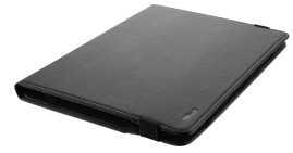
PRODUCT VISUAL 2