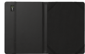
PRODUCT EXTRA 1