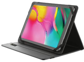
PRODUCT VISUAL 1