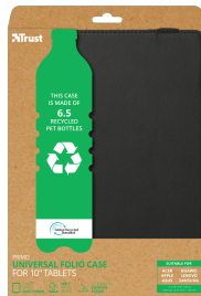
PACKAGE FRONT 1