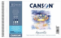
Album spirali - Grana ruvida