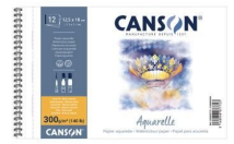
Album spirali - Grana fine