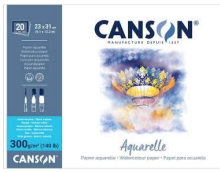
Blocks - Rough grain