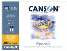
Blocks - Cold pressed