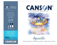
Blocchi collati 4 lati - Grana ruvida