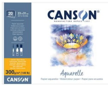
Blocchi collati 4 lati - Grana fine