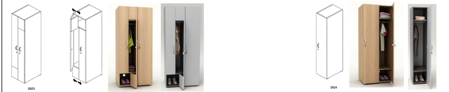
2624 - Modello 1 anta